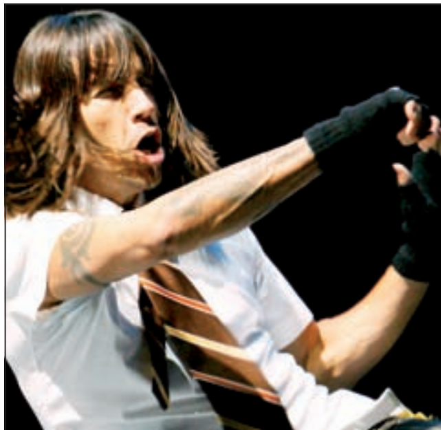
Anthony Kiedis, 45 anni, cantante dei Red Hot Chili Peppers. Nella pagina a fianco, il chitarrista John Frusciante, 37 anni.

Nella foto a sinistra: John Frusciante, Flea, Chad Smith e Anthony Kiedis