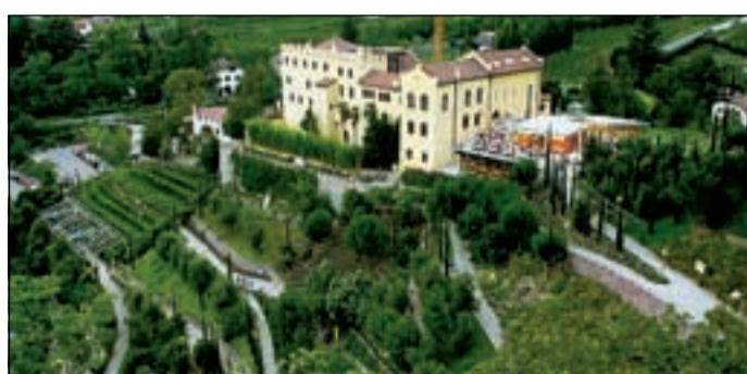
I Giardini di Castel Trauttmansdorff, universo botanico

Le tinte calde dell'autunno rubano progressivamente spazio ai colori estivi in quell'universo botanico rappresentato dai Giardini di Castel Trauttmansdorff. Il "calendario dei fiori" segna, in questo crepuscolo settembrino, le note della maturazione dei grappoli sulle viti di antica origine locale: attraverso il pergolato è ancora intenso l'aroma emanato dalle uve, fra i quali spiccano Moscato e Pfefferer. Stucchevoli sono il rosso vivo dell'acero del Sol Levante nel giardino giapponese e la fioritura delle camelie autunnali. Delicati i profumi dei nivei fiori dalla rosea venatura della varietà "Yae-arare". Sono solo alcuni capitoli della favola che si rinnova di stagione in stagione all'orto botanico, paradiso naturale capace di riprodurre la galassia floreale.