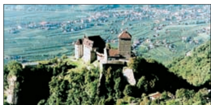
Dominante Merano, Castel Tirolo è abituale sede di mostre

Il 28 giugno 1914 l'arciduca Francesco Ferdinando d'Austria e la sua consorte venivano uccisi a Sarajevo. 91 anni sono trascorsi dall'attentato, "casus belli" che incendiò l'Europa in una Guerra che da tempo covava sotto le braci degli Imperi in dissoluzione. Un anno dopo, anche l'Italia precipitò in quel baratro che in quattro anni inghiottì otto milioni e mezzo di caduti. Un disastro per l'umanità, coinvolta in trincea ma anche al di fuori della stessa: la popolazione, in tutto il continente, soffrì tremendamente le conseguenze di quel conflitto, sotto forma di perdite umane, carestie, tracolli economici, disastri. «Aquila funeste - arte, letteratura e vita quotidiana nella Grande Guerra. Tra delirio e dolore» è la mostra organizzata dal museo storico culturale del-