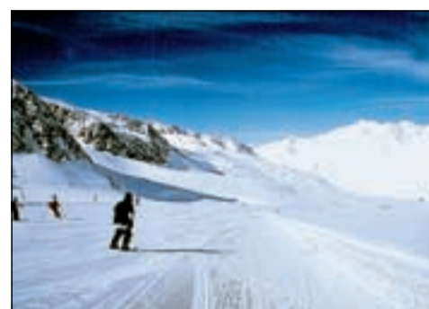
Nel comprensorio 35 chilometri di piste

La neve è la naturale primattrice delle giornate sul ghiacciaio della Val Senales. Una candida coltre che inneva 35 chilometri di piste, un reticolo di tracciati dove tutti possono trovare la discesa adatta alle proprie capacità, per scendere dai 3200 metri di quota ai 2000 di Maso Corto. E per risalire e rituffarsi l'attesa è minima: grazie alla moderna ovovia in circa sei minuti si è ricondotti alla stazione a monte. Per chi non cerca l'adrenalina della velocità, ma la pace e lo sport a contatto con la natura su una pista da fondo dove spendere le energie, temprando corpo e spirito e riempiendo i polmoni di aria frizzantina, non si preoccupi. Ai fondisti si presenta la scelta fra quattro diversi circuiti, di lunghezza compresa tra i 3 e i 10 chilometri. La passione dell'escursionismo può invece essere soddisfatta approfittando di diversi sentieri disegnati appositamente per essere percorribili anche d'inverno. Gioia per i bimbi i 3300 metri lungo cui si snoda la pista per slittini, toboga fra le cui curve tutti hanno la possibilità di misurarsi in affascinanti sfide dai mille imprevisti. Il "parco giochi" sulle nevi della Val Senales si completa con lo "Snow & fun park", dove una half-pipe attende le esibizioni dei talenti della tavola da snowboard. Infine l'apres-ski, luogo d'incontro fra un'esperienza e l'altra.