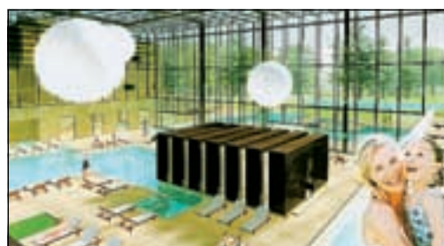
Ricostruzione grafica di quelle che saranno le nuove Terme Merano: una veduta d'insieme e degli spazi all'interno del cubo di vetro