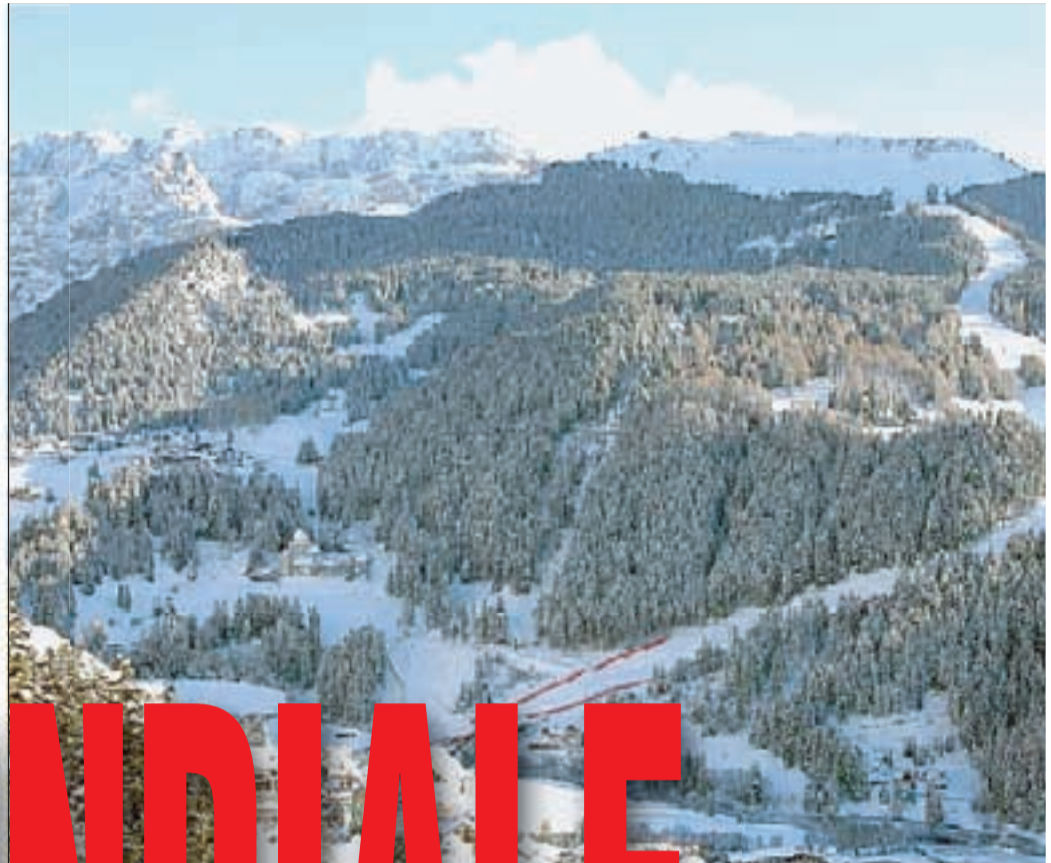
La Saslong in val Gardena