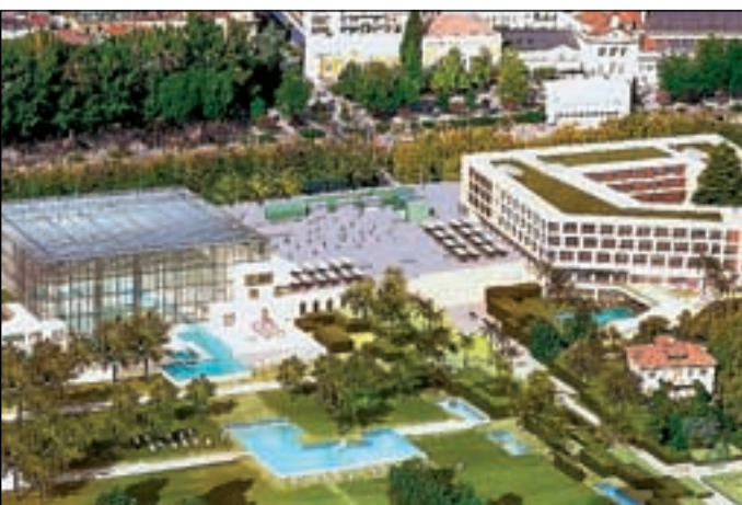
I giardini saranno il fiore all'occhiello delle Terme

Cinque ettari di splendide fioriture mediterranee