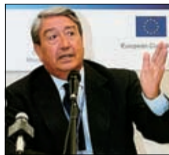
Il ministro Lucio Stanca

Facendo i conti in tasca alla pubblica amministrazione, per ogni lettera con i sistemi tradizionali, la stessa sborsa all'incirca 20 euro, fra operazioni di scrittura, di protocol-