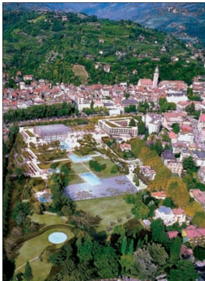
Il complesso termale diverrà presto splendida realtà

In estate, spettacolo nello spettacolo sarà rappresentato dalla grande piscina sportiva che confluisce nel laghetto delle ninfee.