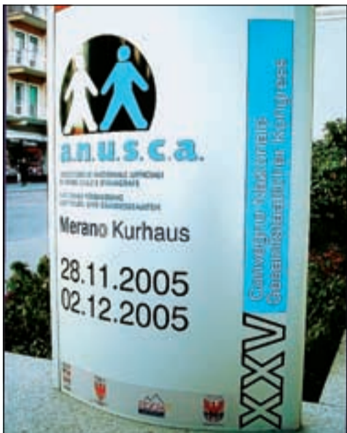
Il totem di presentazione dell'evento

L'introduzione di questa forma moderna di rapporto con i vari servizi permetterà di accorciare le distanze tra i fruitori (cittadini e aziende) e la pubblica amministrazione, riducendo sensibilmente la burocrazia e i costi di gestione dei servizi. L'obiettivo che si pongono le Anagrafi è quello di trasformare il documento elettronico nell'unico strumento di accesso ai servizi erogati dall'ente pubblico. Con la carta si potrà accedere ai vari servizi via Internet direttamente da casa. Una comodità