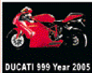
DUCATI 999 Year 2005