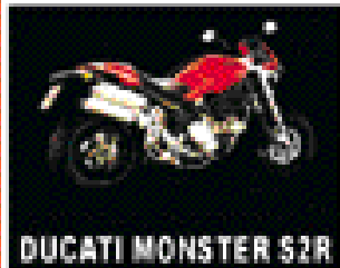
DUCATI MONSTER S2R

TERAMO Via del Mulino Zona Industriale Villa Vomano (A24 - uscita Villa Vomano/Roseto) tel. 0861.329647